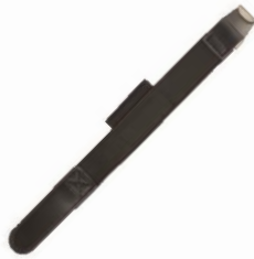
1 x Correa para controladora