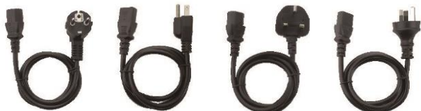
1 x CN20 adaptadores de carga (EU / US / UK / AU)