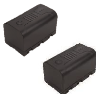
2 x BN20 Baterías