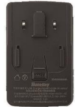
1 x Cargador para batería