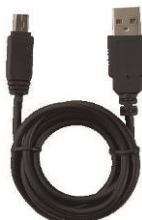
1 x Cable Mini-USB