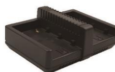
1 x CN20 Cargador dúplex