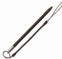
1 x Pluma stylus