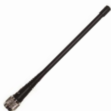
1 x Antena UHF 410-470 MHz