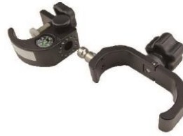
1 x Bracket para controladora