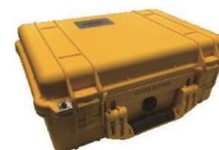
1 x Estuche rígido de uso rudo