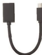
1 x Cable OTG Mini-USB