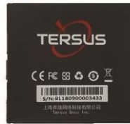
1 x TC20 Batería de Litio