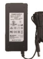
1 x CN20 Eliminador p/cargador