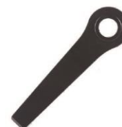
1 x Medidor de altura