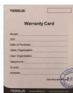
1 x Tarjeta de garantía