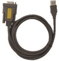
1 x DB9 Cable Serial a USB