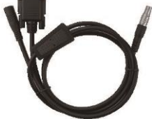
1 x Cable Serial 5 pines a DC JACK