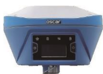
1 x Receptor Oscar GNSS Basic/Advanced/Ulimate